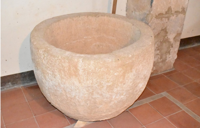
FIGURA 6 PILA BAUTISMAL DE LA ERMITA DE NRA. SRA. DE LA TORRE, CONSERVADA ACTUALMENTE EN LA PARROQUIA DE POZUEL DE ARIZA