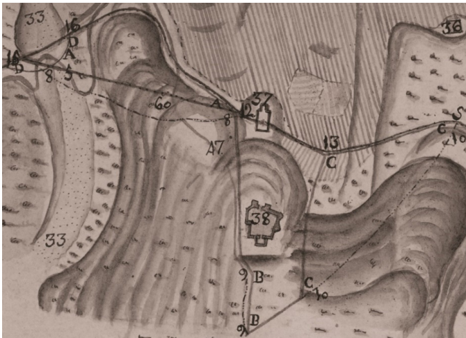
FIGURA 8 DETALLE DEL MAPA DE 1790, QUE REPRESENTA LA PRINCIPAL CONTROVERSIA SOBRE LAS TIERRAS EN LITIGIO, JUSTO DONDE SE EMPLAZAN EL CASTILLO DE LA RAYA Y SU ERMITA

La controversia o discordia que plantea este plano se explica a través de las tres delimitaciones referidas de los peritos contratados por las partes en litigio. Así, por parte del perito de la Marquesa de Camarasa (línea de color azul marcada con el nº 7 en el plano), arranca del referido paraje 11, próximo a las tierras del monasterio hortense, y sigue el camino de Monteagudo a Monreal hasta el Barranco de la Torre (33); luego, basándose en las declaraciones del alcalde y síndico procurador de Monteagudo, marca las porciones A-B-C del plano, respecto de que dicho perito se desvió hacia Castilla, “como demuestran las líneas de puntos demarcadas con los números 8-9-10”.