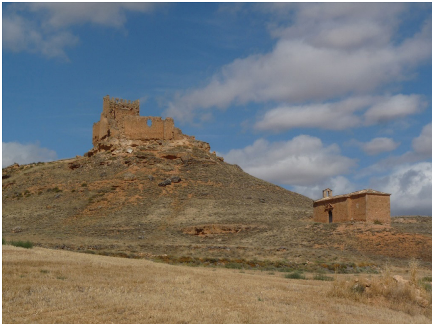
FIGURA 4 VISTA DE ESTADO ACTUAL DEL CASTILLO DE LA RAYA CON LA ERMITA NUESTRA SEÑORA DE LA TORRE A SUS PIES