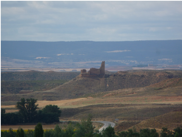
FIGURA 2 VISTA GENERAL DE LAS TIERRAS DE LA CUENCA DEL RÍO NÁGIMA CON EL TERRAZGO DE MARTÍN GONZÁLEZ EN PRIMER TÉRMINO

El denominado en el plano “Terrazgo de Martín González” forma parte del paisaje de páramos calizos, formado por depósitos cuaternarios y sedimentos de arrastre, que rodea la cuenca del río Nágima, afluente del Jalón por la margen izquierda. Los páramos entre los que se ha abierto el valle tienen una altura media en torno a 900 metros, con bordes abruptos como consecuencia de la erosión de los sucesivos barrancos de laderas inclinadas que descienden hasta el río (Gil 2015, p. 461).