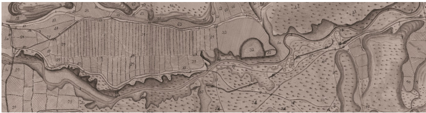
FIGURA 7 DETALLE DEL CURSO DEL RÍO NÁGIMA Y SU CUENCA EN EL MAPA DE 1790

Los límites en discordia de estas tierras del valle del Nágima se encuentran detalladamente descritos en la extensa información marginal reseñada en la larga leyenda del plano, llegando a usar líneas de varios colores (amarillo, azul y rojo) para facilitar la comprensión cabal de las lindes en conflicto, por cuanto actuaron tres peritos agrimensores, que trazaron sus respectivos límites en función de anteriores escrituras de deslinde (al menos, una de 1673 y otra de 1727). Pues se dilucida a través de este documento cartográfico la zona en litigio jurisdiccional entre los referidos marqueses de Camarasa y el concejo de Pozuel de Ariza, diferenciando la demarcación que cada parte defiende de distinto color (azul y rojo, respectivamente).